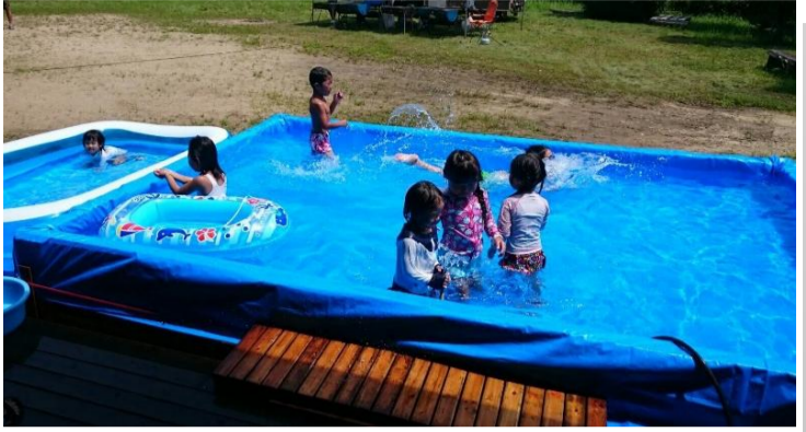
3m×4mの巨大手作りプール(スマツキーにて)

例年ならキャンプ場やバーベキューができる場所を借りて開催するのですが、今年度は雨でも延期できるのと、委員会で